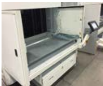
BAIA SINGOLA ESTERNA