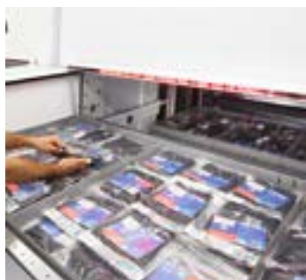
Barra LED alfanumerica