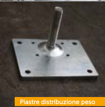
Piastre distribuzione peso