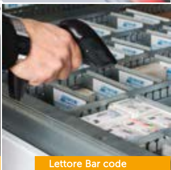
Lettore Bar code