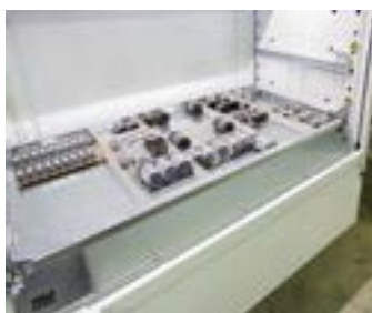
BAIA DOPPIA INTERNA