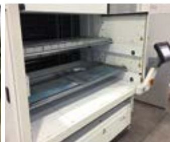
BAIA DOPPIA ESTERNA