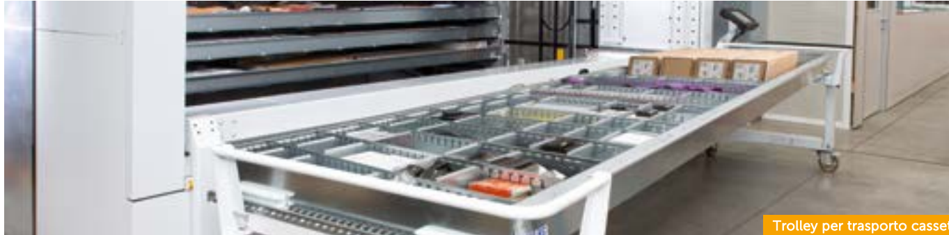
Trolley per trasporto cassetto