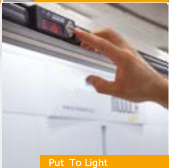
Put To Light