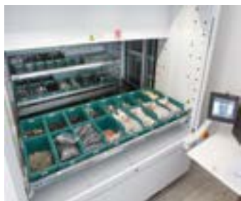
BAIA SINGOLA INTERNA

Il doppio livello di carico è consigliato a chi necessita di un picking veloce e performante poichè incrementa la produttività.